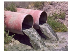
Contaminación de aguas, Valle Central, C.R.

Palabras Clave: ambiente, sostenibilidad ambiental, dominio público, garantías ambientales.